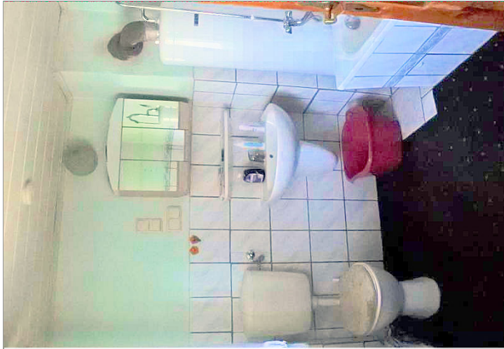
Bad mit Wanne OG