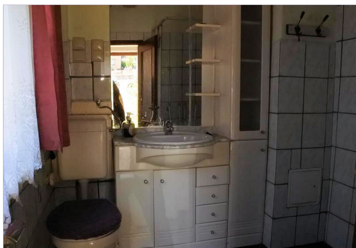
Bad mit Dusche EG