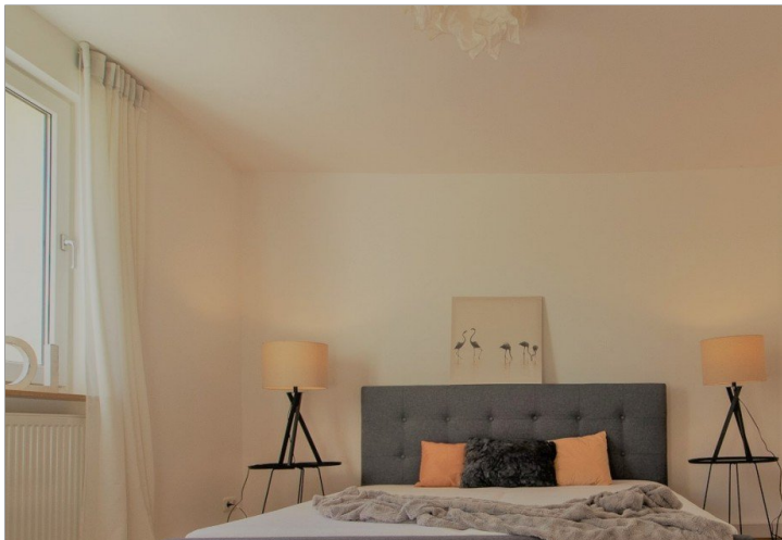
Schlafzimmer, EG - Muster