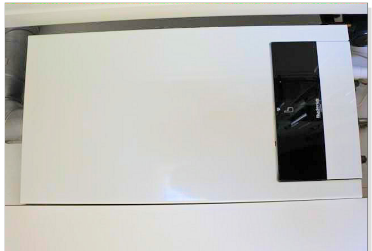
Neue Gasthermen 2020