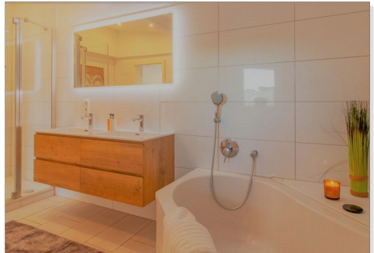
EG - Bad mit Wanne - Muster