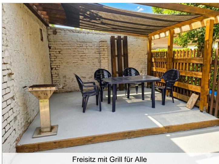
Freisitz mit Grill für Alle