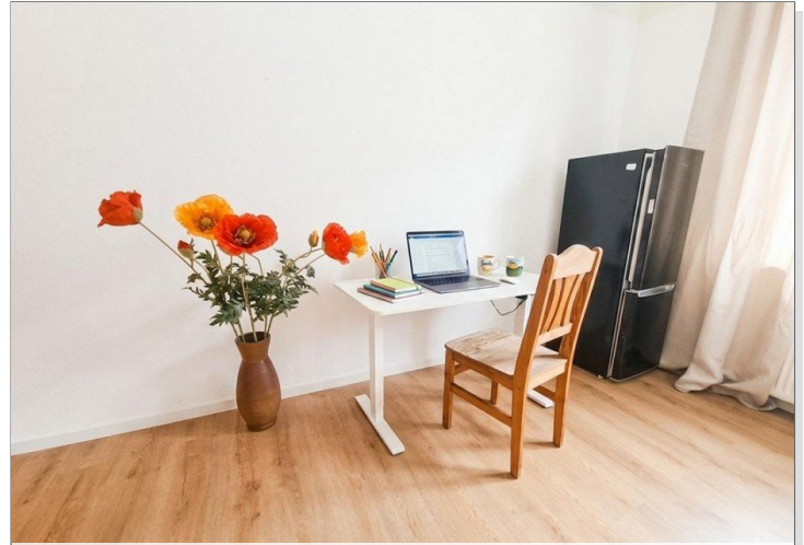
Zimmer 2 Arbeitsplatz