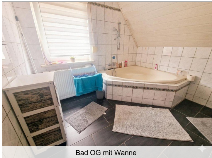
Bad OG mit Wanne