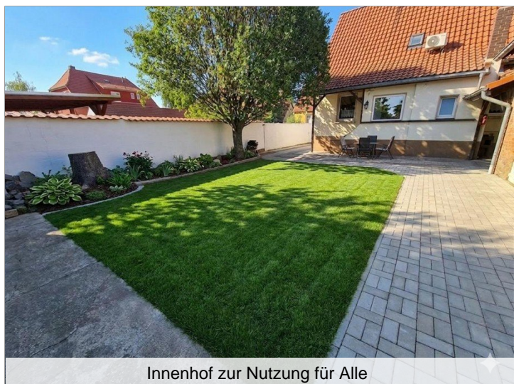
Innenhof zur Nutzung für Alle