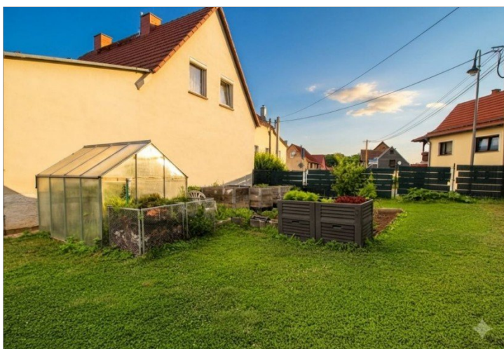
Gartenbereich mit Hochbeeten