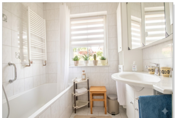
Bad mit Wanne, EG