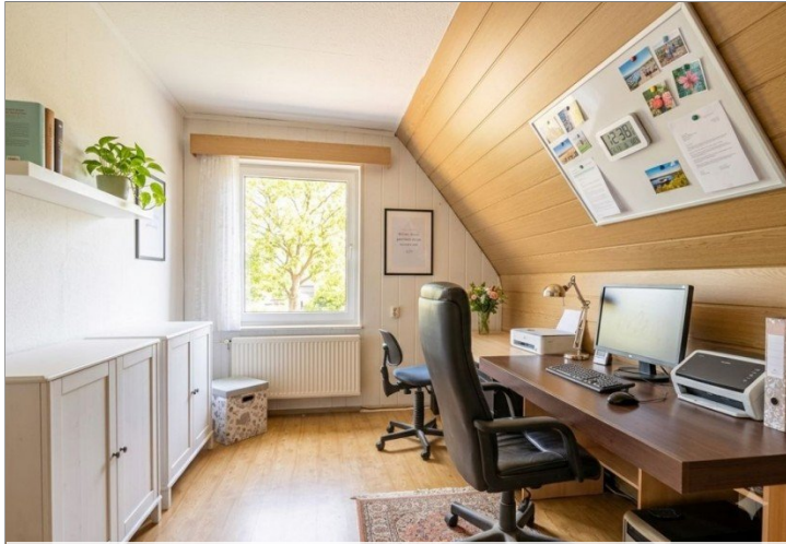
Büro / Schlafzimmer2, DG