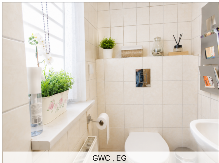
GWC , EG