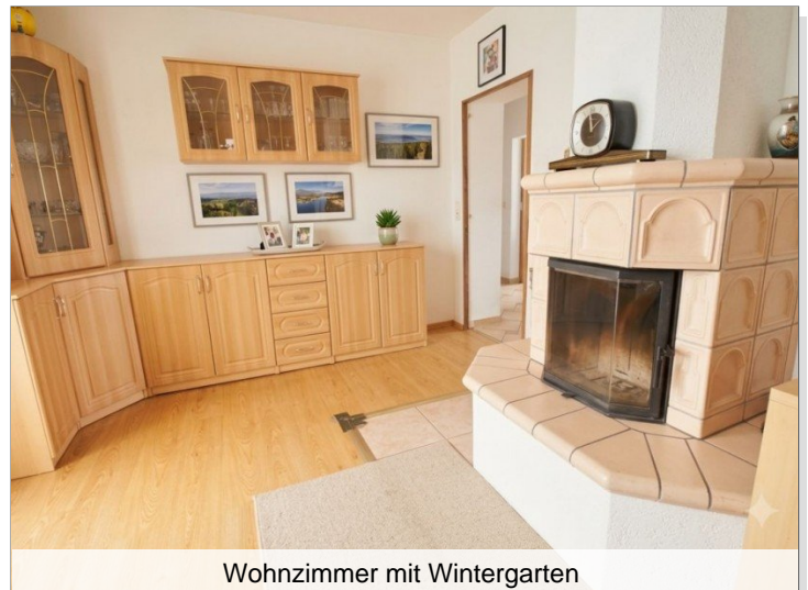
Wohnzimmer mit Wintergarten